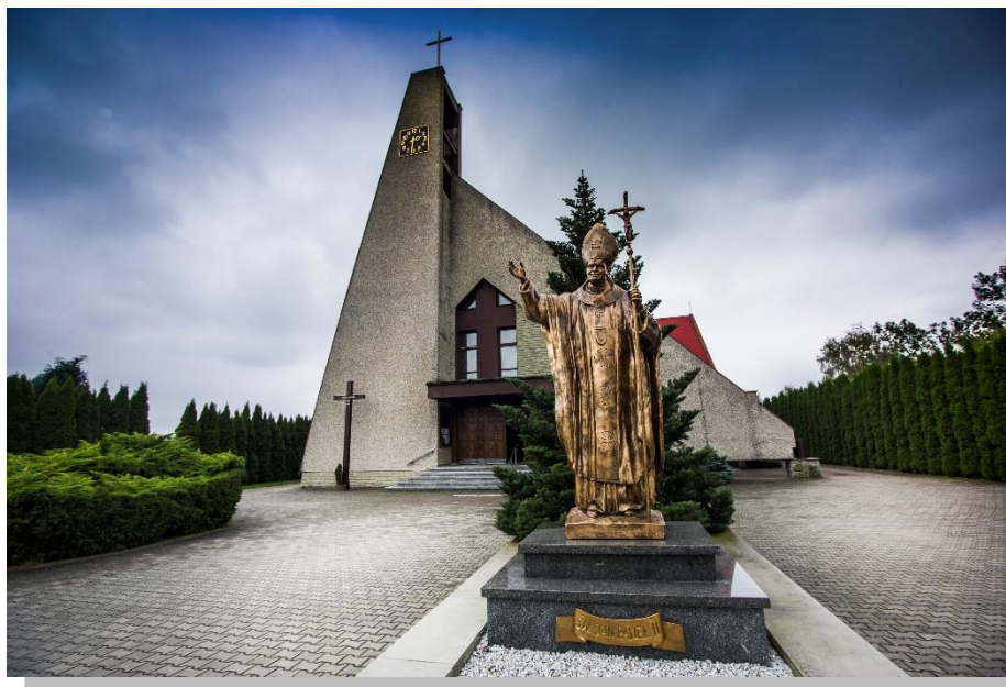
Kościół p.w. Podwyższenia Krzyża Świętego

Obok cmentarza parafialnego przy ul. Rybnickiej znajduje się kaplica cmentarna (wcześniej kościół p.w. Podwyższenia Krzyża Świętego), wybudowana w 1922 r. Na cmentarzu jest również zbiorowy grób polskich żołnierzy poległych we wrześniu 1939 r. oraz mogiła zbiorowa żołnierzy niemieckich zabitych w tym samym czasie. Obok cmentarza znajduje się nowy Kościół p.w. Podwyższenia Krzyża Świętego konsekrowany w 1997 r.