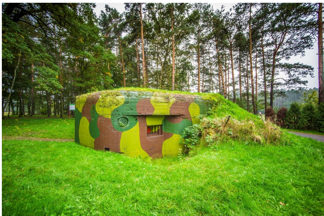
Schron bojowy „Sowiniec”

Na terenie miejscowości Gostyń znajdują się również budowle fortyfikacyjne z 1939 r. Są to 2 schrony: przy ul. Tęczowej (tzw. „Sowiniec”) oraz w rejonie Starej Piły. Na terenie kompleksu leśnego można znaleźć fragmenty nieukończonych budowli (fundamenty).