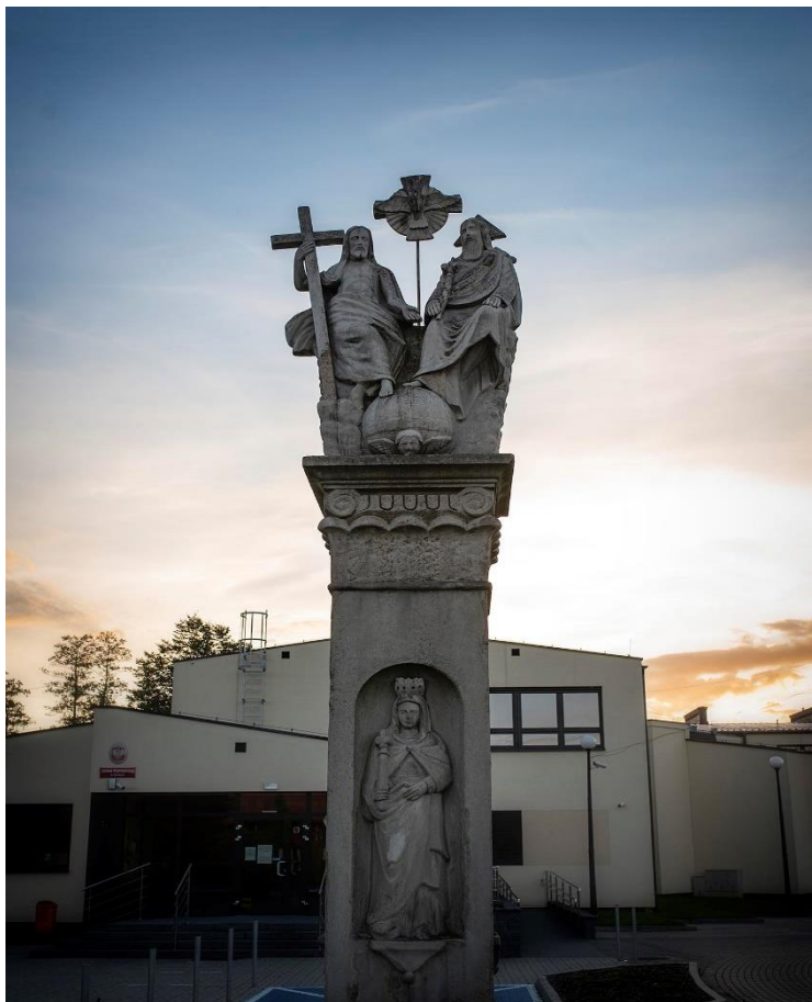
Figura Trójcy Świętej przy ul. Pszczyńskiej

Przy ul. Rybnickiej znajduje się Kościół p.w. Świętych Apostołów Piotra i Pawła wybudowany w latach 1935 – 1939.