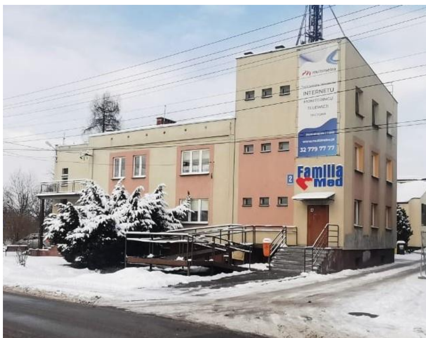
Budynek ośrodka zdrowia

Uchwałą nr XVIII/124/2000 Rada Gminy Wiry postanowiła wybrać formę organizacyjną prowadzenia Podstawowej Opieki Zdrowotnej na terenie Gminy Wiry od 1 stycznia 2001 roku, w postaci indywidualnych lub grupowych praktyk lekarskich jako niepubliczny Zakład Opieki Zdrowotnej, zapewniających mieszkańcom podstawową opiekę zdrowotną zarówno w miejscowości Wiry jak i Gostyń.