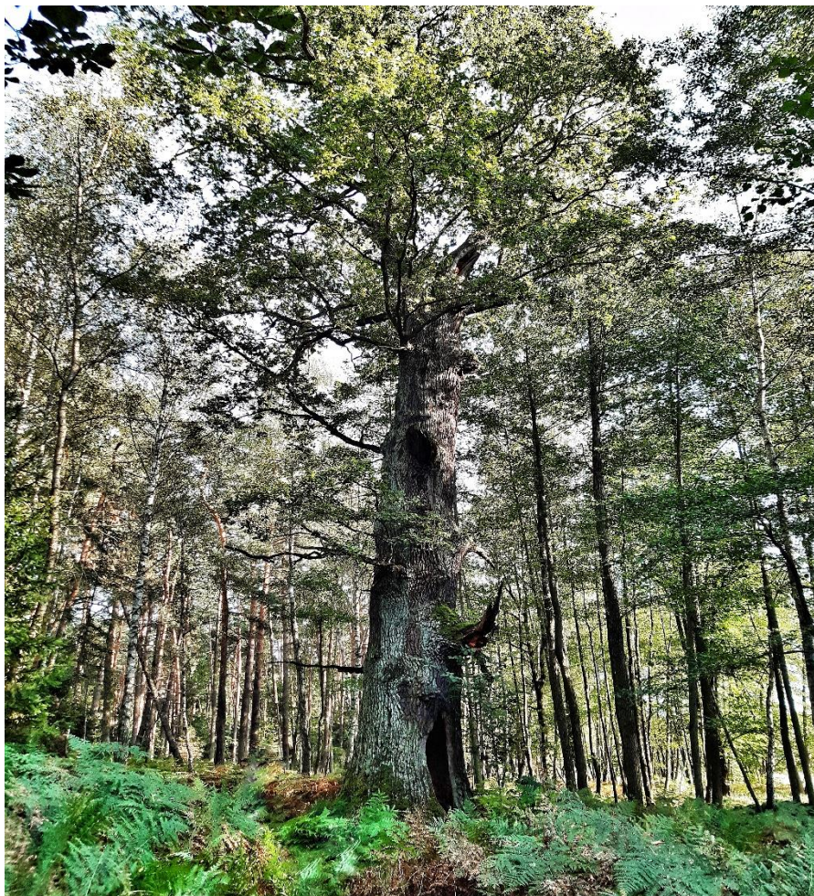
Dąb szypułkowy – pomnik przyrody