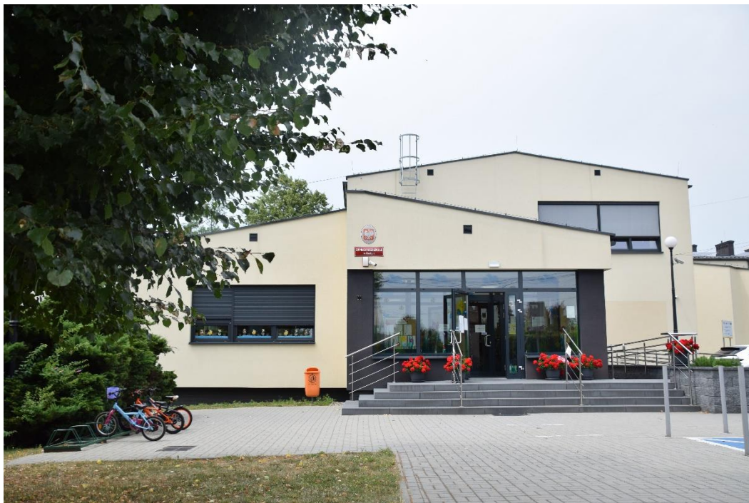
Budynek Gminnego Przedszkola w Gostyni

Obecnie w przedszkolu znajduje się 6 sal zajęć, w których na co dzień przebywa 149 przedszkolaków oraz przeszklone pomieszczenie ogrodu zimowego. Budynek przedszkola wyposażony został w windę dla osób niepełnosprawnych, obsługującą parter i I piętro. W terenie, wokół budynku wykonano szereg prac, m.in.: wyremontowano istniejące i wykonano nowe nawierzchnie utwardzone, doposażono istniejący placu zabaw o nowe urządzenia, wyremontowano nawierzchnię przed wejściem głównym, wydzielono miejsce parkingowe dla osób niepełnosprawnych.