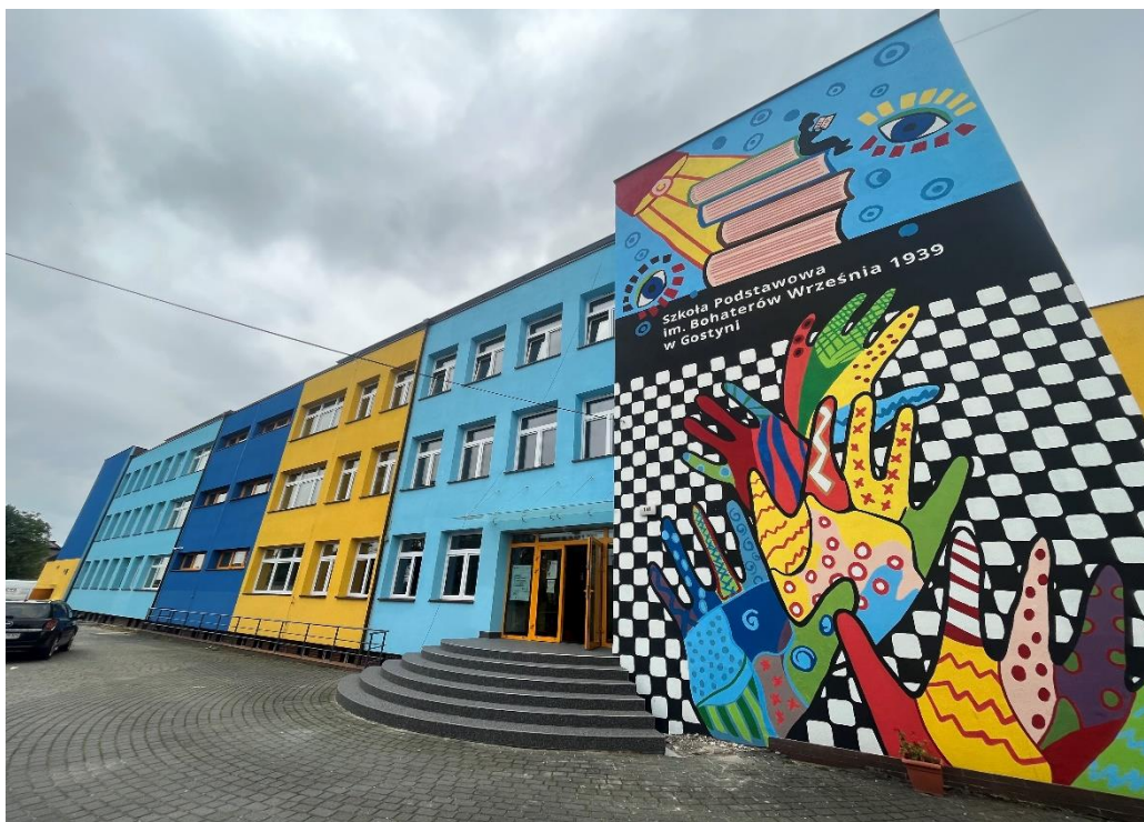
Budynek Szkoły Podstawowej w Gostyni