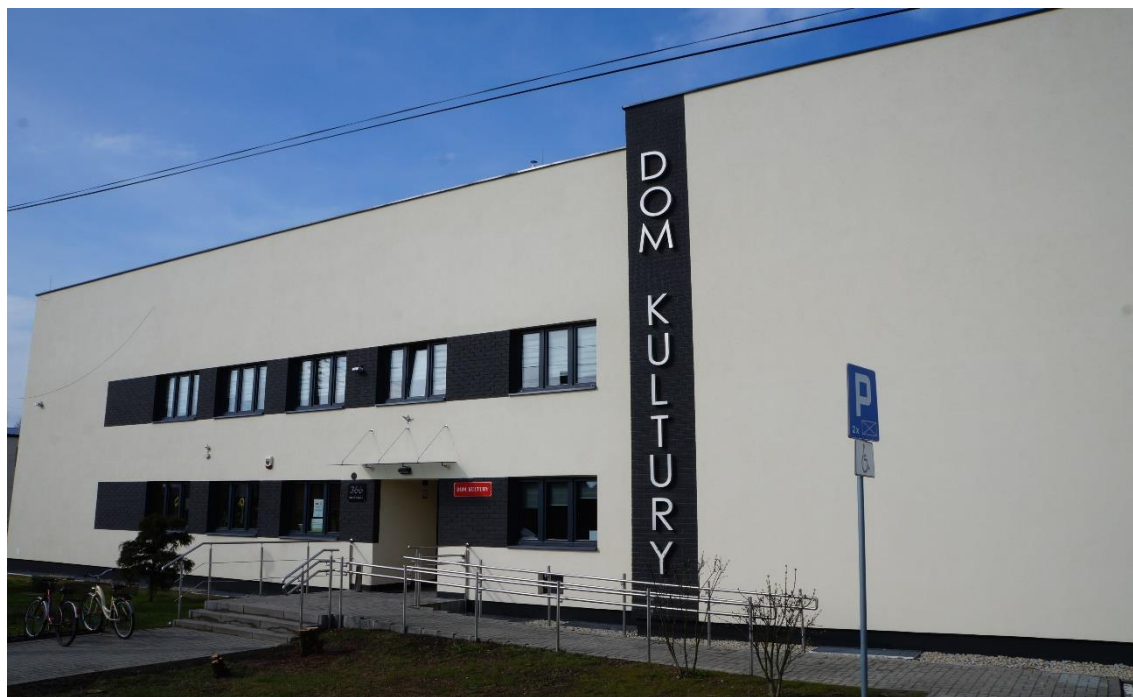
Budynek Domu Kultury w Gostyni

W Domu Kultury organizowane są również liczne zajęcia mające wpływ na rozwój kulturalny i styl życia mieszkańców, tj. m.in.: gimnastyka, wyjazdy i wycieczki, spotkania seniorów, spotkania działaczy i administratorów kultury oraz imprezy i zabawy okolicznościowe. Ponadto Dom Kultury posiada pod wynajem sale na szkolenia, wesela i imprezy okolicznościowe.