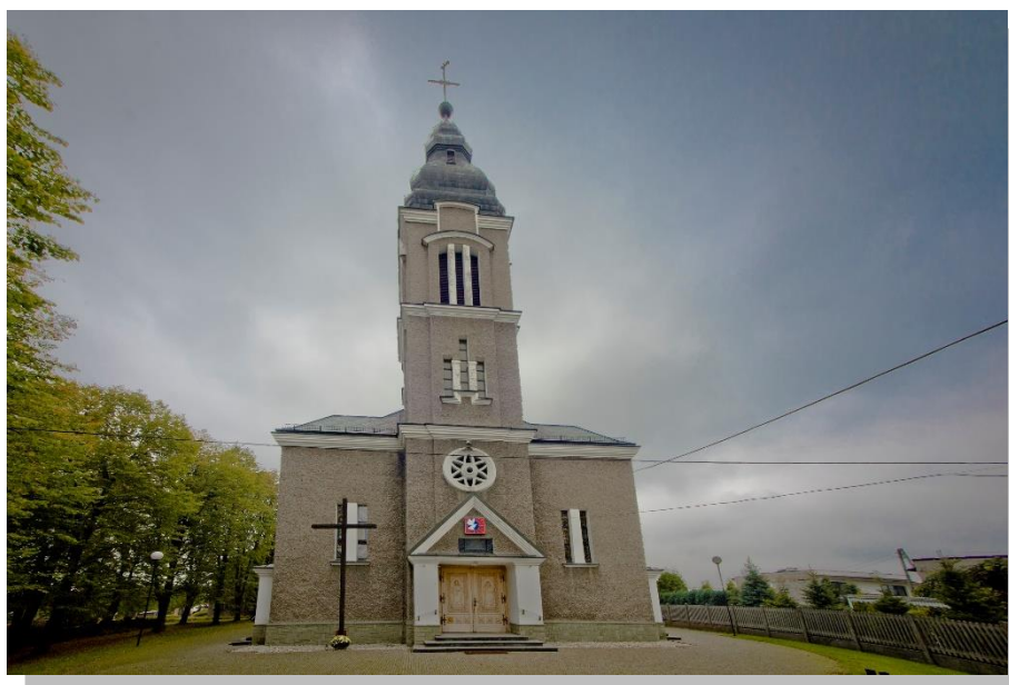
Kościół p.w. Świętych Piotra i Pawła

Przy ul. Rybnickiej znajduje się Kościół p.w. Świętych Apostołów Piotra i Pawła wybudowany w latach 1935 – 1939.