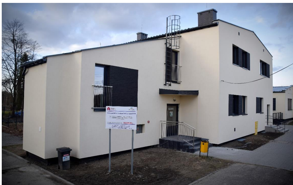
Siedziba świetlicy środowiskowej w Gostyni

Opiekunowie w świetlicy dbają by dzieci miały dobrze zorganizowany czas wolny. Dzieci korzystają z udostępnionych dla nich różnego rodzaju gier, zabaw, oglądają filmy, bajki. Często wychodzą także na spacerów bądź uczestniczą w zorganizowanych wycieczkach. Kiedy trzeba odrobić pracę domową także mogą skorzystać z pomocy w nauce, opiekunowie również starają się rozwijać zainteresowania wśród młodzieży, poprzez organizację różnych zajęć tematycznych.