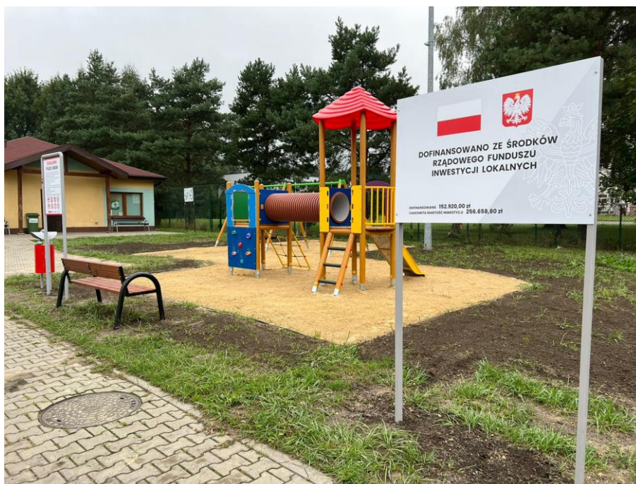
Plac zabaw przy kompleksie rekreacyjno – sportowym za Szkołą Podstawową