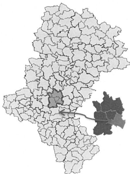
Województwo śląskie z zaznaczonym powiatem mikołowskim i po prawej powiat mikołowski z wyróżnioną Gminą Wiry

Gmina Wiry zajmuje powierzchnię 34,5 km 2 i położona jest w centralnej części województwa śląskiego w powiecie mikołowskim. Jednostka stanowi 14,9% powierzchni powiatu. Według danych z 2014 roku ludność Gminy wynosi 7679 mieszkańców, a gęstość zaludnienia to w przybliżeniu 222 osób/km 2 . Gmina Wiry sąsiaduje od strony północnej z Mikołowem, od południa z Kobiórem, od zachodu z Orzeszem i Łaziskami Górnymi, a od wschodu z Tychami.